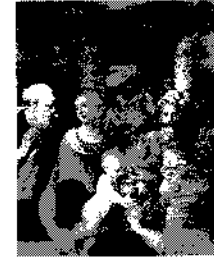
PARMIGIANINO Adorazione dei Magi, 1529 circa