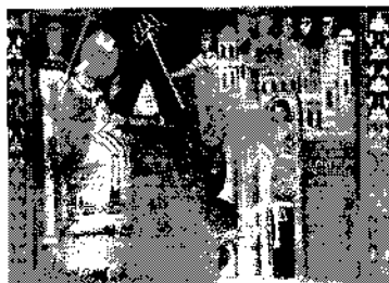
ORATORIO DI SAN SILVESTRO - Roma Donazione di Costantino, 1248